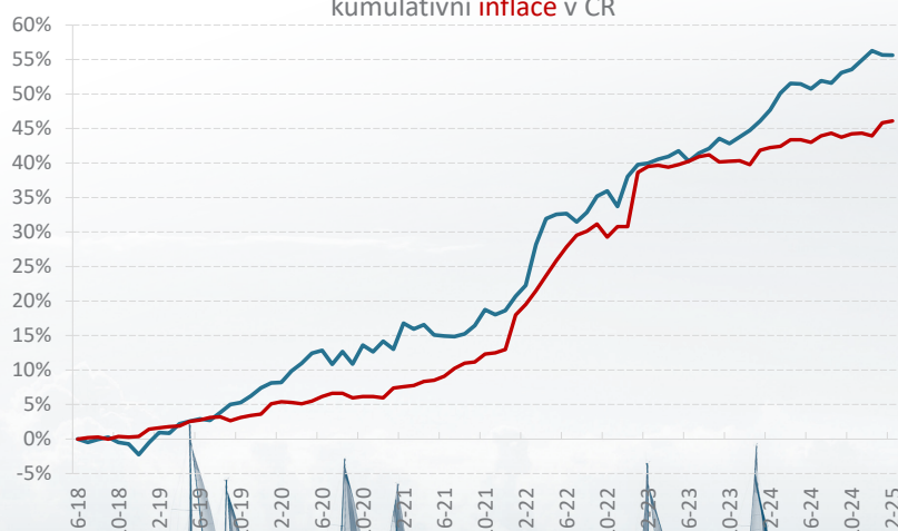
Kumulativní čistý výnos fondu Sirius Alpha vs. kumulativní inflace v ČR

Poslední čtvrtletní zprávu k výkonnosti fondu (za 4. čtvrtletí) naleznete na druhé stránce.